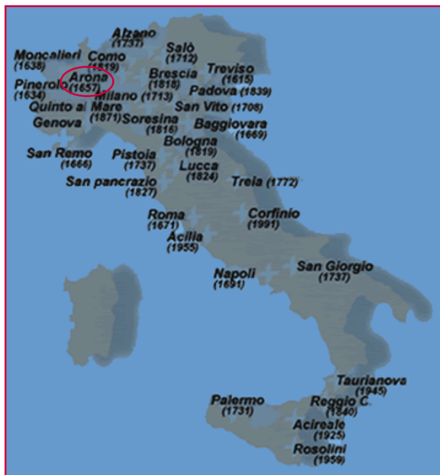
Diffusione dell'Ordine della Visitazione

Il monastero di Arona, nel limite delle proprie possibilità, è sempre aperto all'accoglienza di chi desidera avere un colloquio consolatorio o di discernimento.